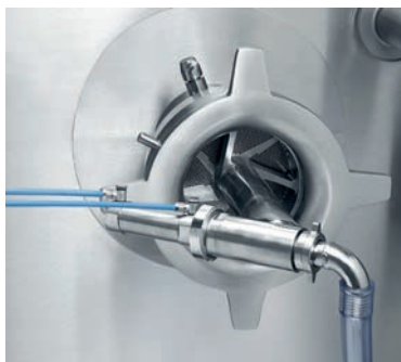
Pneumatische bediende afvoer van de gesepareerde delen (optioneel)