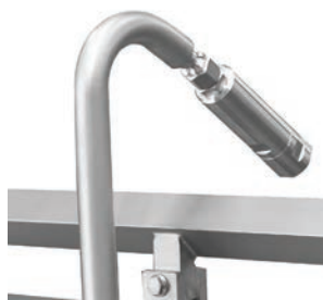
Niveaumeting d.m.v. laser (optioneel)