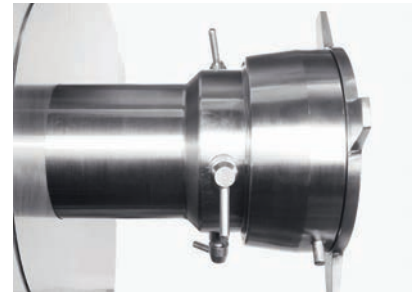
Fixeerinrichting snijzet (optioneel)